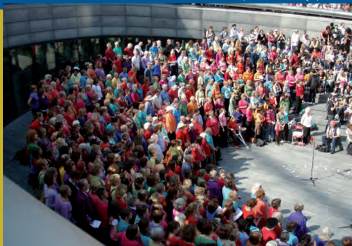
"Sing for Water", un acto para recaudar fondos.