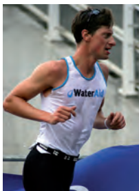
Participante en el triatlón de Londres, que recauda fondos para WaterAid

Además de contribuir a los acontecimientos de recaudación de fondos, los colaboradores de WaterAid participan también en las campañas de sensibilización e información. La comunicación y los datos sobre los resultados llegan a los donantes a través de la revista semestral (Oasis) y de un boletín electrónico bimensual. Las empresas del sector del agua informan sobre las acciones y las actividades de WaterAid a través de sus comunicaciones de empresa.