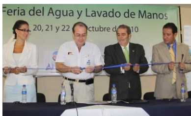
Acto de inauguración de la “Primera feria del agua y lavado de manos”

Entre el 20 y 22 de octubre se ha desarrollado en El Salvador la Feria del Agua y lavado de manos , enmarcada en las actividades realizadas en conmemoración del Día Interamericano del Agua y el Día Mundial del lavado de manos.