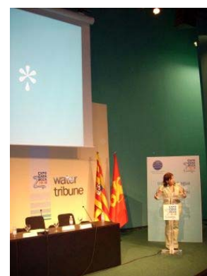
"La Ministra de Medio Ambiente de Nicaragua, Juana Argeñal, fue la encargada de clausurar la sesión".