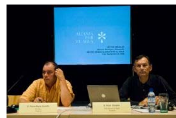
Momentos de la jornada.