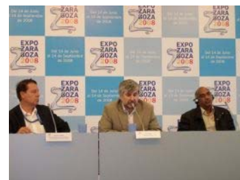
Rueda de prensa del vaso.