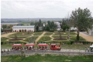
Instalaciones del CIAMA, en la Alfranca.

El Secretariado de la Alianza por el Agua participó en el encuentro “Una mejor información para la toma de decisiones en la gestión del agua”, celebrado del 4 al 7 de mayo en el Centro Internacional del Agua y el Medio Ambiente (CIAMA) de La Alfranca, organizado por el Departamento de Medio Ambiente del Gobierno de Aragón y la Organización para la Cooperación y el Desarrollo Económico (OCDE).