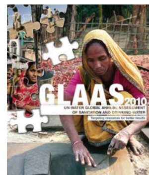
Portada del Informe.

Para consultar el resumen y descargar el Informe completo, pulse aquí.