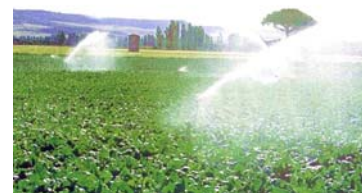
El objeto de estudio han sido las superficies de regadío.

El trabajo titulado "Seguimiento diario de la evapotranspiración a escala regional con imágenes de satélite de Landsat-TM y ETM+. Aplicación en la región italiana de Basilicata", se publicó en el año 2008 en la revista internacional Journal of Hydrology .