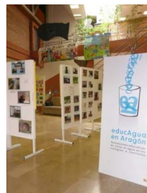
1ª edición de EducAgua.

Por su parte, la Alianza por el Agua dio a conocer a los asistentes la campaña 'Gotas de Solidaridad' y la web de recursos educativos sobre el Agua y los Objetivos de Desarrollo del Milenio. Además, desde el Secretariado, se animó a los centros a ejercer una conducta ejemplarizante mediante el ahorro de agua en sus instalaciones, como primer paso para inculcar a los alumnos el uso eficiente de los recursos hídricos.