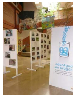
1ª edición de EducAgua.

Por su parte, la Alianza por el Agua dio a conocer a los asistentes la campaña 'Gotas de Solidaridad' y la web de recursos educativos sobre el Agua y los Objetivos de Desarrollo del Milenio. Además, desde el Secretariado, se animó a los centros a ejercer una conducta ejemplarizante mediante el ahorro de agua en sus instalaciones, como primer paso para inculcar a los alumnos el uso eficiente de los recursos hídricos.