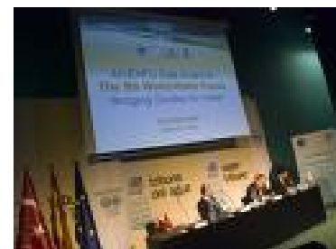
Presentación del V Foro mundial en la Expo 2008.

A este Foro de Estambul, asistirá además la Dirección General del Agua del Ministerio de Medio Ambiente y Medio Rural y Marino de España, estamos participando activamente en la preparación de este Foro, y esperamos tener una importante presencia en las sesiones oficiales. Además, España contará con un stand en la Expo Mundial del Agua, que se celebra dentro del marco del V Foro Mundial del Agua. También se organizarán tres eventos paralelos con las siguientes temáticas: "Agua y Energía en Agricultura", "Tratamiento y reutilización del agua" y "Desalación".