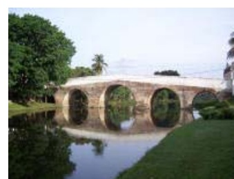
Vista del Río Yayabo.

Para consultar la noticia completa: www.escambray.cu/Esp/s/Srioyayabo0901091145.htm .