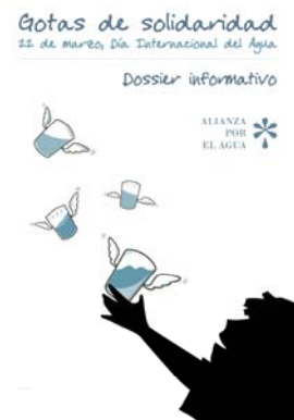
Cartel de la campaña

La campaña de venta de bolsas se organizará en centros educativos de Zaragoza, aunque se quiere extender la propuesta a otras comunidades para conmemorar el día de reflexión en torno al agua.