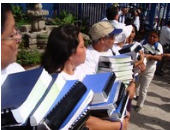
Campaña ‘El agua es nuestra’.

La campaña ‘El agua es nuestra’ también demanda incluir la integración de la dimensión ambiental en los procesos de crecimiento económico y desarrollo social en la región.