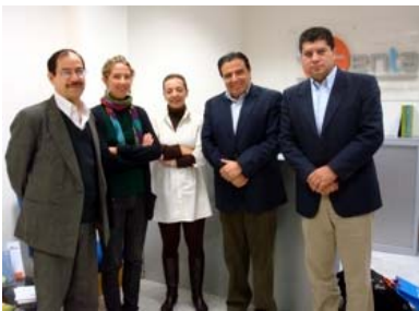
Miembros del FOCARD y del CENTA.

Una delegación del Foro Centroamericano de Agua Potable y Saneamiento (FOCARD-APS) visitó el mes de diciembre las instalaciones de la Planta Experimental de Carrión de los Céspedes del CENTA dentro del programa de visitas que están realizando realizaron por el país con la colaboración de la Alianza por el Agua.