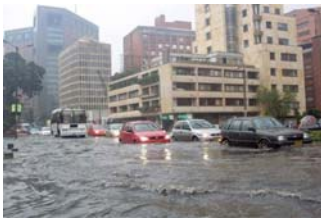
Inundaciones en 2009.

Según la OMM, en el año 2009 se registraron temperaturas superiores a lo normal casi en todas las partes del mundo.