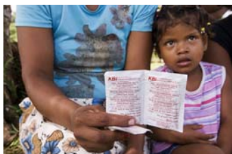
Autor: Scott Harrison

Secretariado Alianza por el Agua Plaza San Bruno 9 50.001 ZARAGOZA