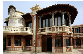
Sede de la Década del Agua de NU.

También pueden solicitar más información en la Oficina de la Década del Agua: teléfono +34 976 478 346/347 ó email water-decade@un.org .