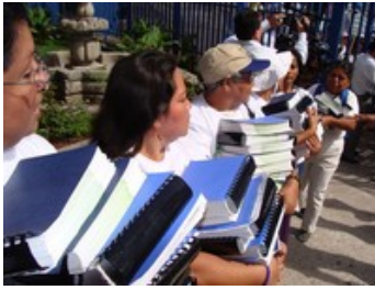
Ciudadanos y organizaciones a las puertas de la Asamblea.

Miles de salvadoreños han pedido a los diputados de la Asamblea Legislativa del país reformar la Constitución para reconocer el Derecho Humano al Agua. En total, la campaña ciudadana que lleva por nombre 'El agua es nuestra' ha presentado 38.000 firmas para esta petición, aunque espera