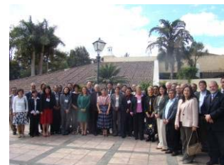
Participantes en el encuentro.

La VI Conferencia, organizada por GWP Centroamérica, contó con el apoyo del Congreso de la República de Guatemala, WWF Centroamérica y la Alianza por el Agua. Más información en: http://www.gwpcentroamerica.org/?cat=2&evt=64&show