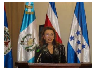
La Diputada, Maureen Ballesteros.