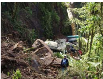
La Catarata de la Paz, antes y después del Seísmo.

El terremoto registrado el pasado 8 de enero en Costa Rica ha dejado 15 víctimas mortales, 91 heridos y 47 desaparecidos, además de provocar numerosas afecciones en los sistemas de salud y agua y saneamiento en numerosas comunidades, según los datos de la Organización Panamericana de la Salud.