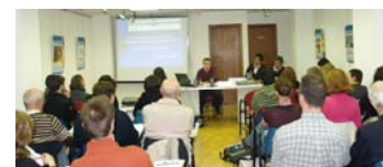
Participantes en la jornada.