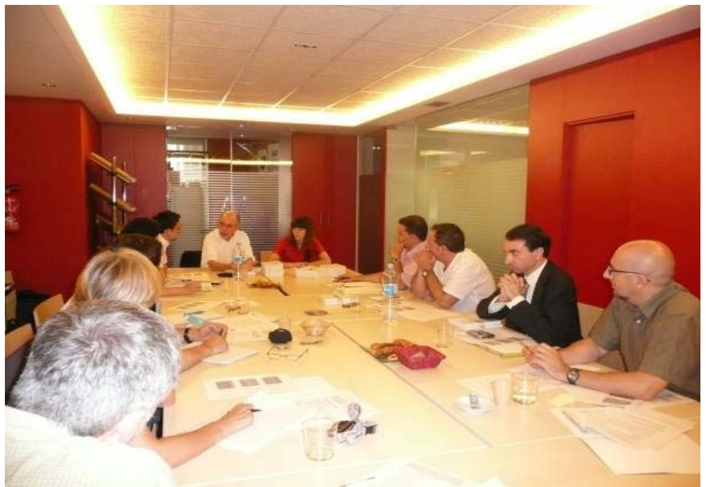
Reunión de la Comisión Permanente en Julio de 2008.

La reunión tendrá lugar el miércoles, 10 de diciembre, en la sala 2 de la sede de Cruz Roja en Madrid (Avenida Reina Victoria, 26). El horario previsto para la cita es de 11 de la mañana a cinco y media de la tarde.