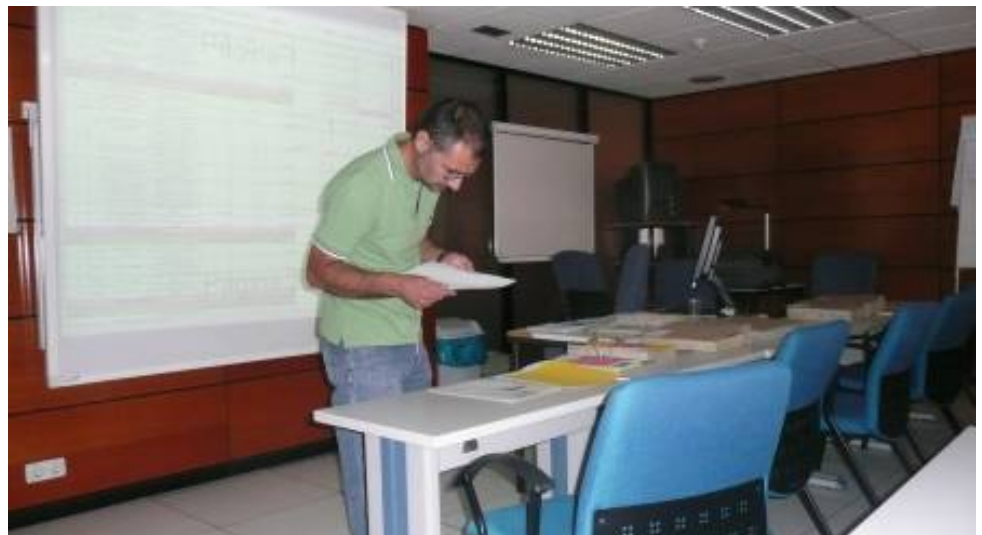
Presentación de evaluador ante la Comisión Permanente española.

La II Convocatoria de Pequeños Proyectos de Interés Comunal contaba con un monto total de 285.000 euros. De estos, 145.000 euros proceden de la Dirección General del Agua del Ministerio de Medio Ambiente y Medio Rural y Marino de España, y 140.000 euros, de la recaudación del vaso Fluvi durante la celebración de la Exposición Internacional Zaragoza 2008, ‘Agua y Desarrollo Sostenible’ hace ahora un año.