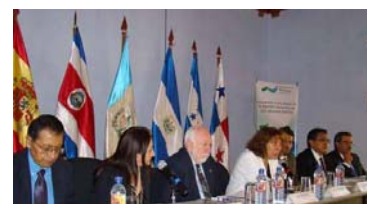
Representantes de entidades regionales en el acto.

El Taller es una iniciativa de GWP Centroamérica, con el apoyo organizativo FOCARD-APS, PAS-BM, COSUDE, el Grupo Financiero de la Iniciativa Europea para el Agua (EUWI), el Ministerio de Ambiente y Recursos Naturales de Guatemala (MARN) y el Centro de Formación de la AECID.